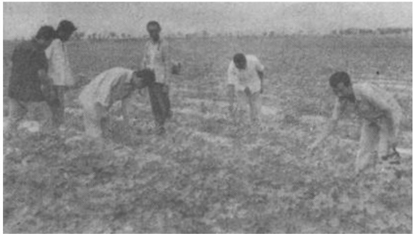
7月上旬，垦利县宁海乡800亩棉田普遍发生蚜虫及棉铃虫。乡政府及时组织群众喷药灭虫。图为乡政府领导深入田间检查灭虫情况。